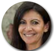
Anne Hidalgo Maire socialiste de Paris