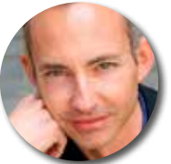
Ian Brossat Porte parole du PCF