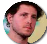
Julien Bayou Secrétaire national d'EELV