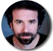
Cyril Dion Écrivain et réalisateur