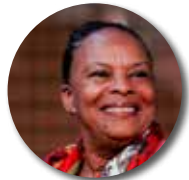
Christiane Taubira Ancienne Garde des Sceaux