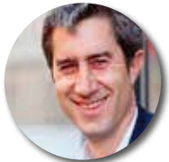
François Ruffin Député Insoumis