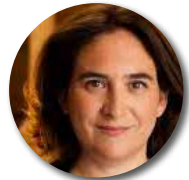
Ada Colau Maire de Barcelone

“ Eric Piolle a ouvert à Grenoble la Voie d’une intégration du politique, du social et de l’écologique. D’où l’importance pour tous de son expérience ” Edgar Morin